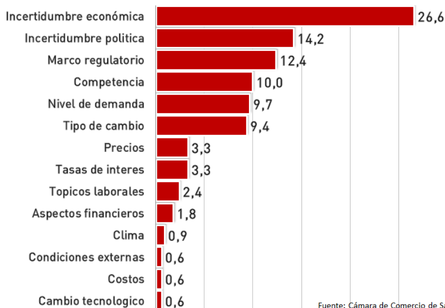
Principales Preocupaciones Empresariales Diciembre 2016 (% de las menciones totales)