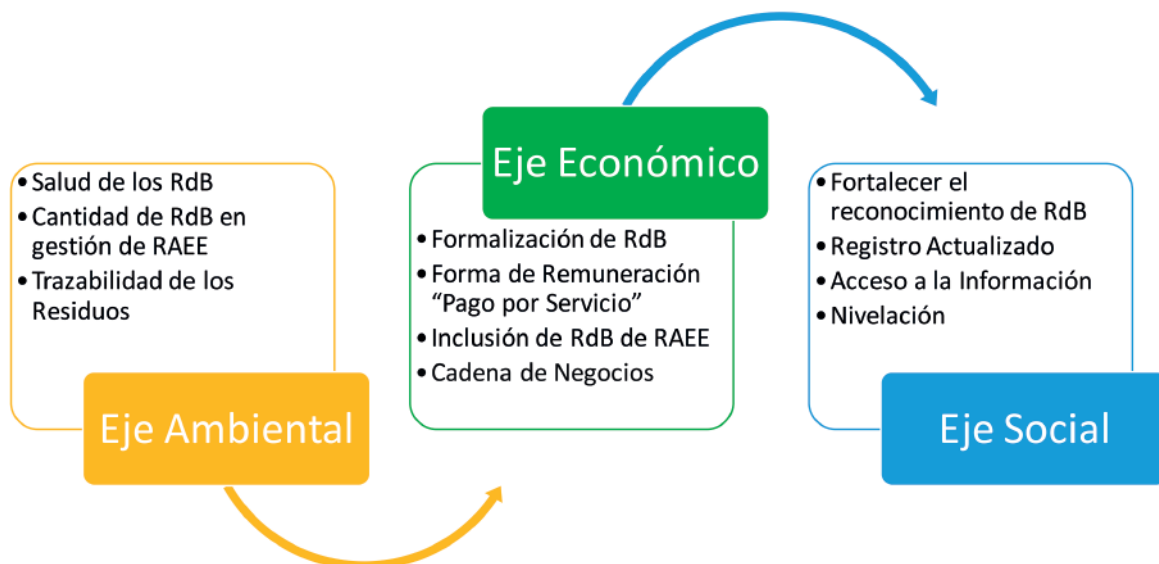
Ilustración 2 Ejes a considerar en el Modelo de Inclusión

A continuación se presentan los principales puntos a considerar en este eje de trabajo, no obstante, de forma transversal se propone trabajar con una